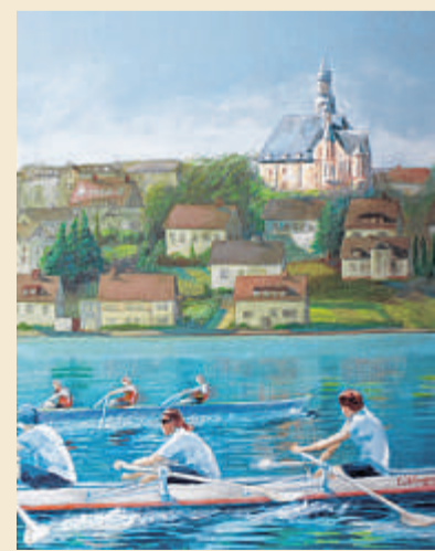
Harkortsee, Wolfgang Hohmann, Acryl auf Leinwand, 80 x 60 cm.