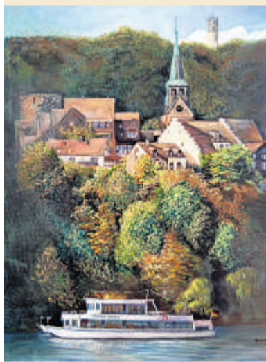
Blick auf die Freiheit in Wetter, Isaura Gomes, Acryl, 100 x 80 cm.