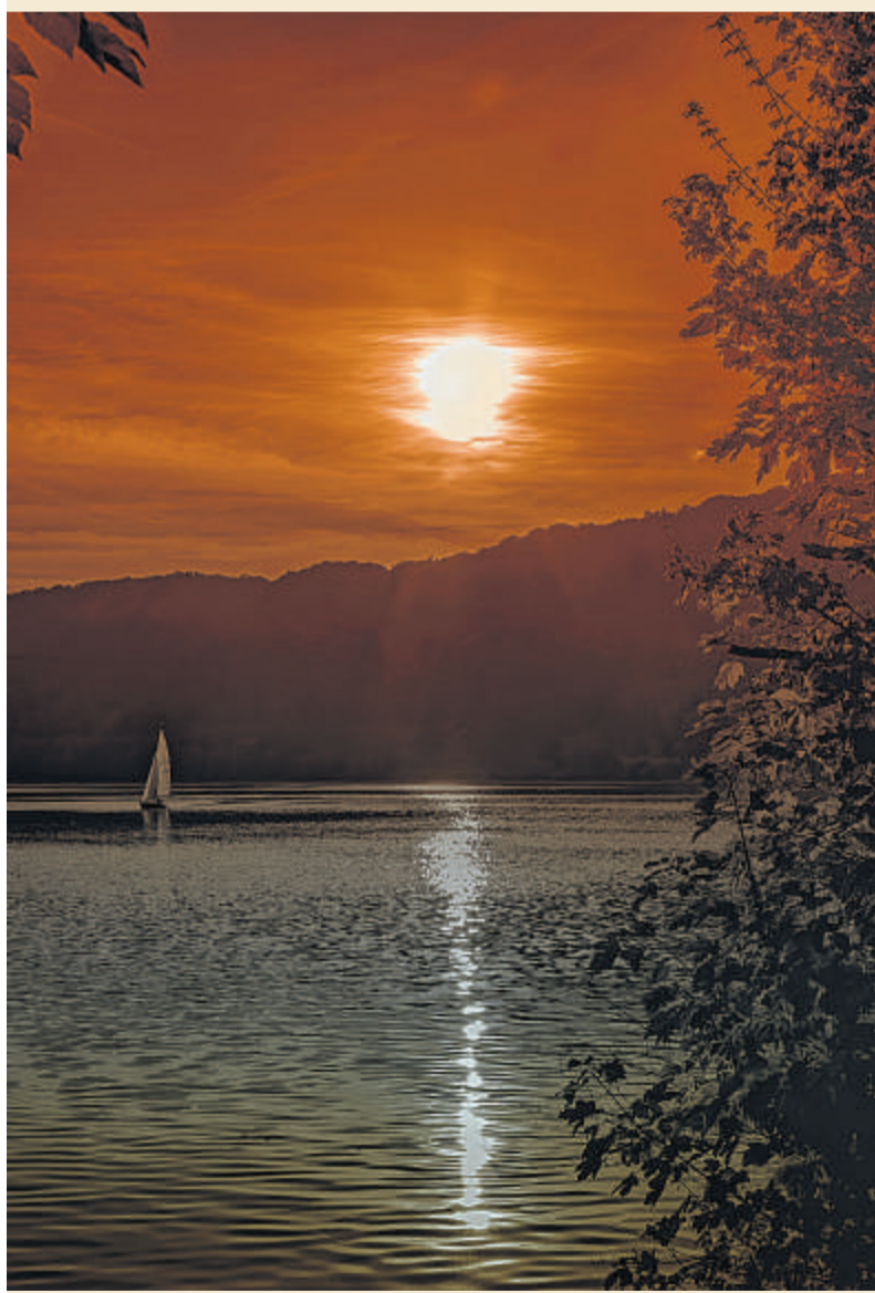
Sonnenuntergang am Harkortsee, Fotografie von Torsten Mühlhoff aus dem Jahr 2012. Der Wetteraner ist Vorsitzender von „Diversity of Arts“.

grundlegenden Werten wie Vertrauen, Offenheit, Transparenz, Fairness, Teamgeist, Demut sowie gegenseitiger Wertschätzung“ basieren soll: „Die Künstlergemeinschaft erschafft Kunst aus Freude an der Kunst und zur Begeisterung anderer Menschen.“ Motivation für das eigene Handeln in der Künstlergemeinschaft seien der freundschaftliche Austausch untereinander sowie die positive Wahrnehmung des Geleisteten durch andere als Teil dieser Gemeinschaft. eli