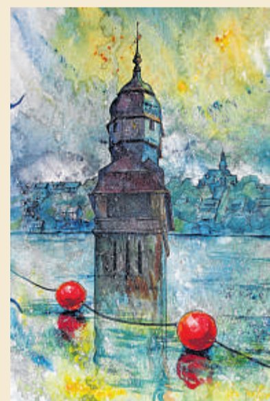
Rathaus: Olga Vinnitskaya, Aquarell mit Kerzenwachs auf Papier, 64 x 50 cm.