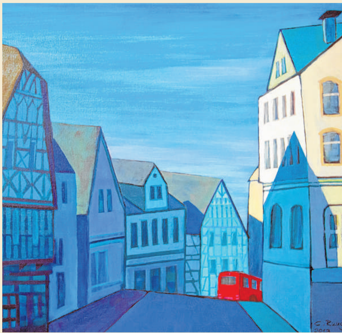
Roter Bus in Volmarstein, Claudia Runge, Acryl auf Leinwand, 50 x 60 cm. Claudia Runge ist seit 2009 Studentin an der Kunstakademie Wetter.